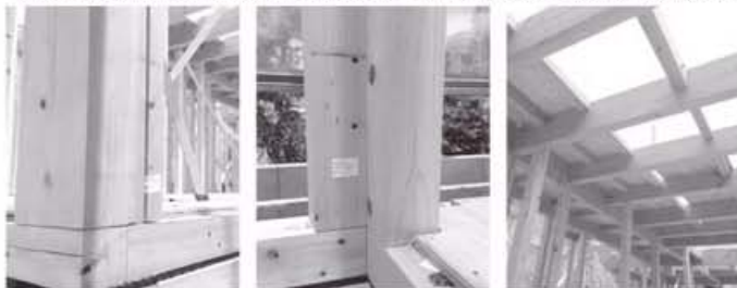
ILT-X工法での施工事例写真

※在来軸組工法とは、主に柱や梁などの角材を使って家の骨格を組み立て、金物で補強する工法です。