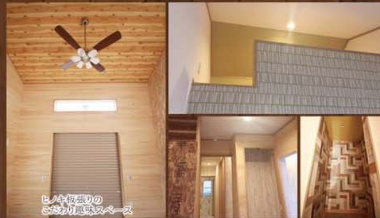
ヒノキ板張りの こだわり趣味スペース

お子さま向け イベントも開催♪ 1/14 土 15 日 AM10:00~PM4:00